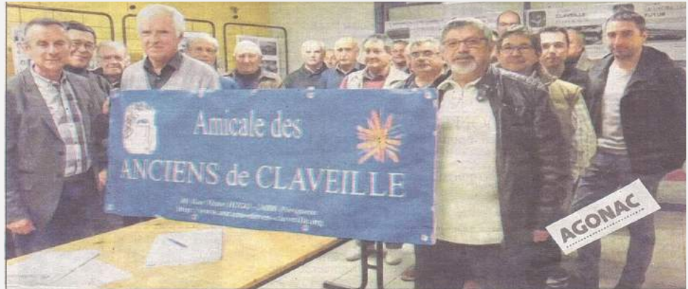
Cette première journée de retrouvailles a permis de se remémorer de bons souvenirs.

Contactez/Emile Maly emile.maly@free.fr 05 53 04 64 18