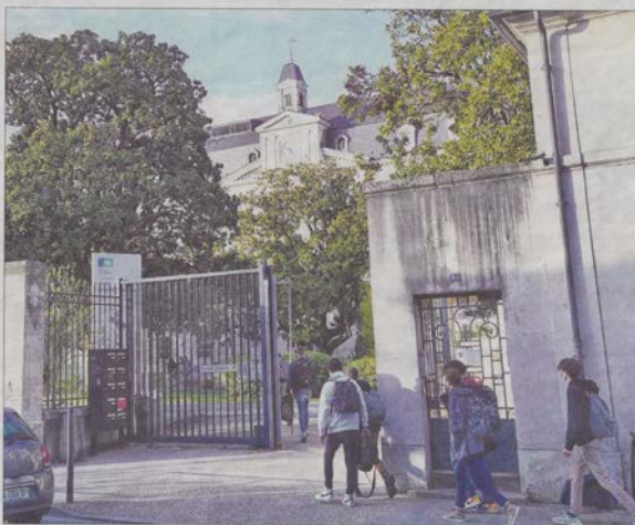
Claveille garde cette année sa deuxième place avec un taux de réussite de 99 %.

Chaque année, ces résultats sont scrutés à la loupe. Si le ministère de l'Éducation affirme qu'ils n'ont pas vocation à établir un classement des lycées, pour autant, ils donnent une petite idée sur le parcours d'un lycéen dès son entrée en seconde et jusqu'à son bac, en