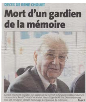
Photo prise par Bernard DELGUEL lors d'une visite lorsqu'il était hospitalisé.