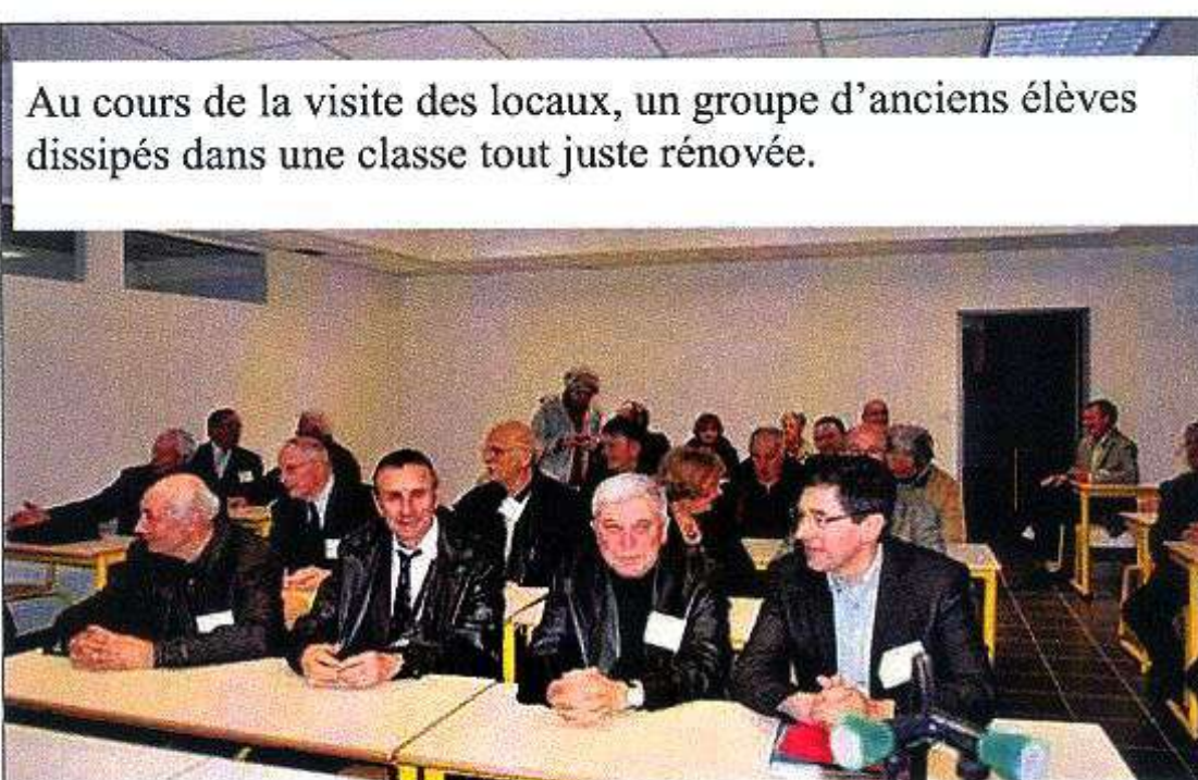
Au cours de la visite des locaux, un groupe d'anciens élèves dissipés dans une classe tout juste rénovée.

Nous avons eu cette chance de vivre dans une époque bien différente de l'actuelle et de partager rigueur et difficultés mais aussi d'acquérir des valeurs et des racines « à vie ».