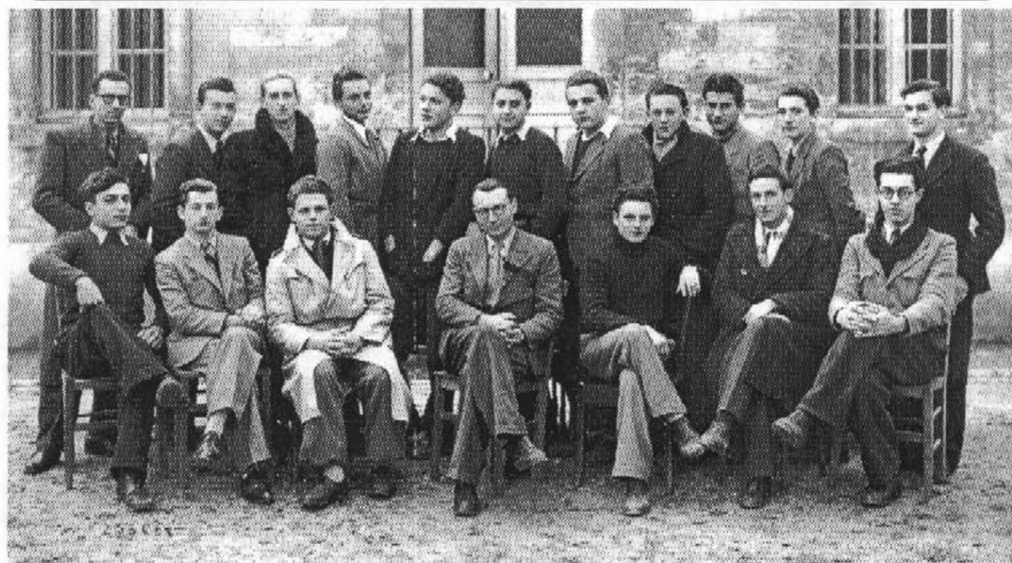
Première Moderne 1945/46