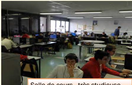
Salle de cours...très studieuse