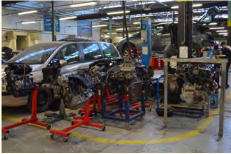
Ateliers Maintenance des Véhicules