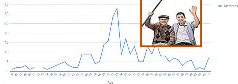
Pyramide des âges 31/12/2019