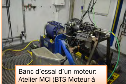
Banc d'essai d'un moteur: Atelier MCI (BTS Moteur à Combustion Interne).