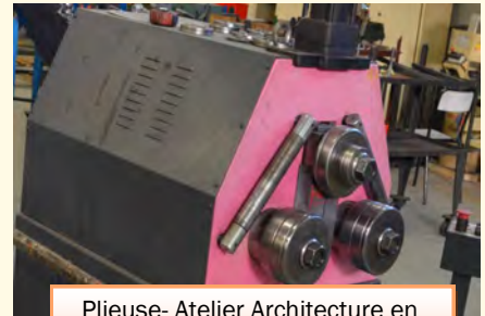
Pieuse- Atelier Architecture en métal Conception et Réalisation